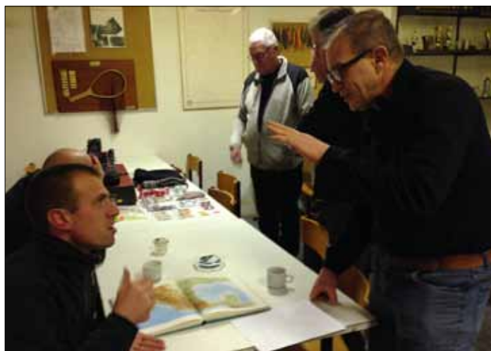
Her ses et udpluk fra klubaftenen "Køb eller sælg".

1 OKT Jagt og Fritidshuset cup (UFV) (S)(J) Pris kr. 50,- Kan vi gøre det igen? Vi har nu de sidste 3 år vundet såvel forårets som efterårets kystkonkurrence imellem foreningerne på Vestsjælland. Og det skal vi da blive ved med. Så tilmeld jer, der er også individuelle præmier til de tre første i hver klasse. Hver forening kan indveje 10 fisk i klassen ørred, torsk og fladfisk. Start kl. 00.00, indvejning og præmieuddeling fra kl. 14.00-14.30 på P-pladsen ved Slagelse Camping & Outdoor Center, Karolinevej 2. Tilmelding til Jens O. Jensen, 5195 4232.