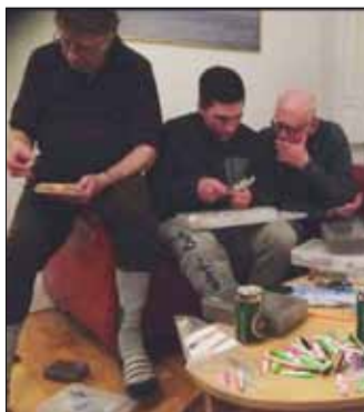
Der hygges om aftenen.