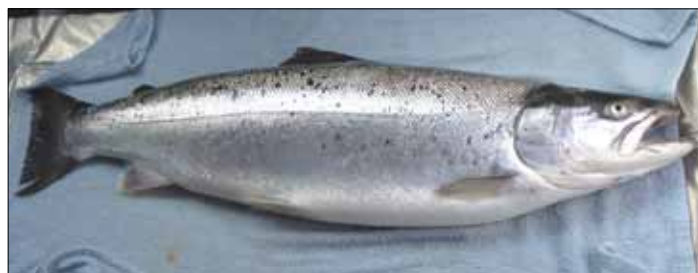
Her ses en del af det vindende hold i UFV Cuppen. Øverst Eriks vinderfisk.

Vi besluttede også at give Projekt Vildfisk en chance til her i 2017, for at se om det ændrer sig til det bedre, ellers må vi stoppe arbejdet, desværre! Derudover har vi i foreningen optalt årets gydegravninger i Gudum Skovse å med et resultat på 37 gravninger, næsten det samme som året før, hvilket fortsat er et deprimerende lavt tal! Jens