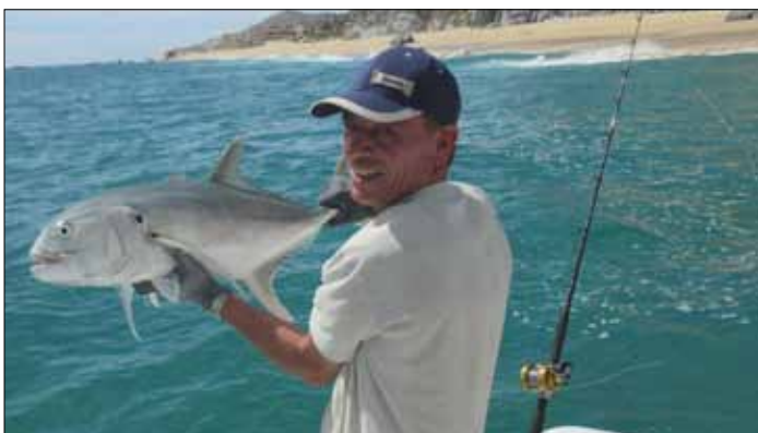
Jes med fin Jack Trevally.