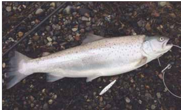
Pæne havørreder fra Møn.