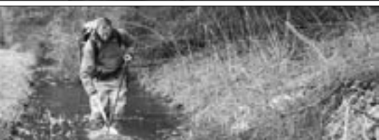
Sådan ser det rygbåre el-udstyr ud.