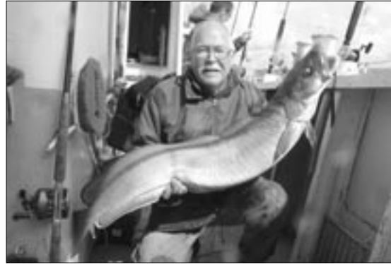
Igen en ny PR. Denne gang en lange på 10,4 kg.

Det blev også til flotte kulmuler. Her er "mule" på 5,25 kg.