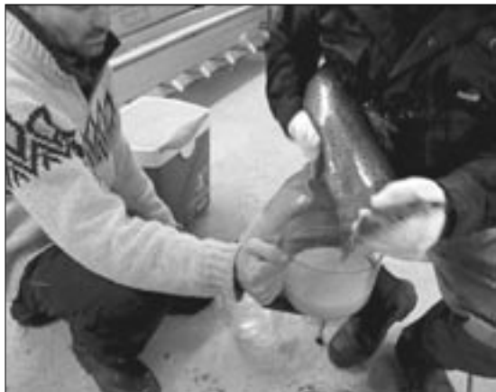
Så bliver der strøget.

Fiskene skal tilbage i deres rette element.