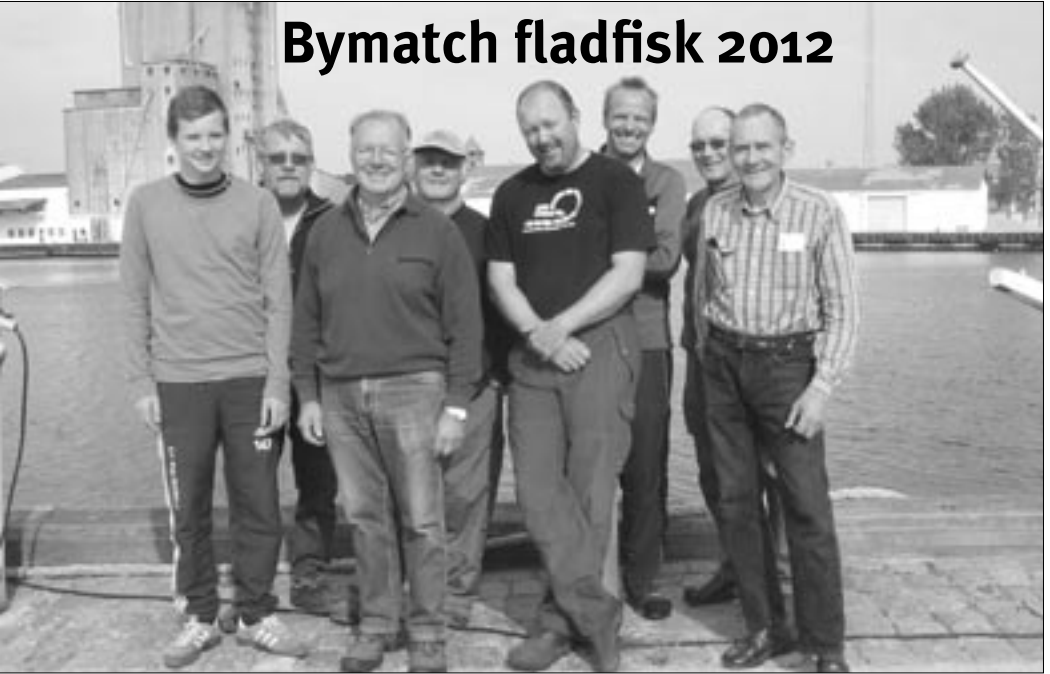
Vinderholdet fra Gørlev Sportsfiskerforening

Dysten stod denne gang mellem Korsør, Gørlev og Høng, og blev afviklet på "Bien", en båd som gør det rigtig godt, når det gælder om at finde fladfishene.