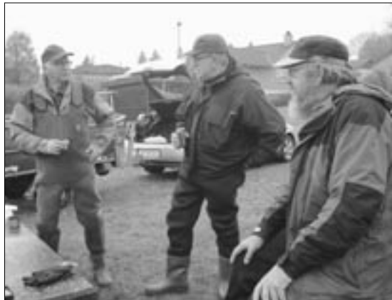
"Krisemøde" ved Havrebjerg.