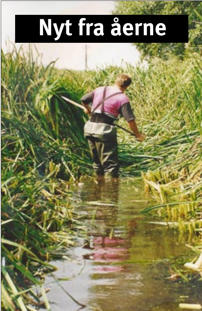
Grødeskæring som vi helst ser den!

Efter en dejlig lang, men også meget tør sommer nærmer efteråret aktiviteter sig. Grødeskæringen er gået i gang, så nu håber vi at den bliver noget mere skånsom end sidste år hvor der mange steder var helt ryddet. De første øjenvidneberetninger er desværre ikke for optimistiske! Vi skal også her i slutningen af september udsætte 28.300 halvårsfisk, heraf skal de 9.200 stk. udsættes i Gudum Skovse, så der venter lidt af et arbejde for os. Det er så første gang i mange år