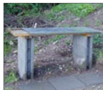
Det nye rensbord.

trappetrin vejer 110 kg? Det er vi nogen stykker, der fandt ud af. Nu mangler vi at lægge nye fliser, noget som vi vil gøre næste år. Så er vi helt færdige med tingene udenfor hytten. Læg mærke til, når du kommer en tur til søen, at der også er opsat nyt rensbord samt ny (og stor) grill. Næste år vil vi også reservere bådene på dagene for vores arbejde, dels for at de frivillige, som ønsker det, kan komme en tur på søen bagefter, dels fordi der er meget lidt motiverende at skulle flytte sig for andre medlemmer, der i stedet for at melde sig til noget frivilligt arbejde, har valgt at tage ud og fiske. Så hold øje med programmet og vær klar til at tage din tørn næste gang vi kalder. Tak til alle, der var nede og hjælpe. Jes