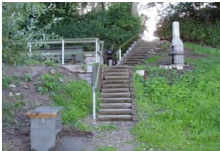
Sådan ser de nye trapper, grill og rensbord ud nede fra broen.

det da, at sammensætte nogle hold til begge weekender. Og så var det ellers bare med at smøge ærmerne op og komme i gang, godt hjulpet af et par "arbejdspladsledere", der kunne fordele kræfterne rigtigt. Og der blev knoklet igennem, skal jeg love for. Frokost og eftermiddag stod foreningen for maden og det var et par velfortjente pausemåltider, hvor folk lige kunne få lov at puste ud. Vi havde reserveret alle bådene begge weekender, således at de frivillige efter endt arbejde, kunne tage en tur på søen og slappe lidt af med