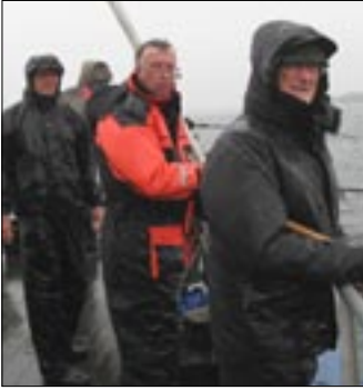
Det regnede på turen med Græsholm.