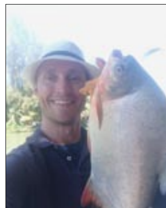
Ca Chim, 2 kg. Vietnam april 2015.