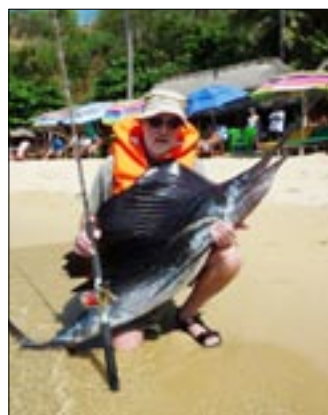
Sailfish, 28 kg. Mexico februar 2015