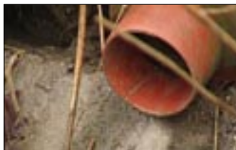
Ingen udledning af urensset spildevand, tak!

Ang. projektet med genslyngning af Tude å og oprettelsen af den omstridte engsø, er der nu udkommet en hvidbog og hvor vores indsigelser stort ikke er blevet tilgodeset, en utroligt arrogant holdning af kommunen, der er ødelæggende for det fremtidige samarbejde. Trist, trist, trist!