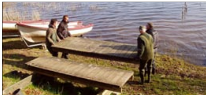
De tunge brofag bæres på plads af stærke folk