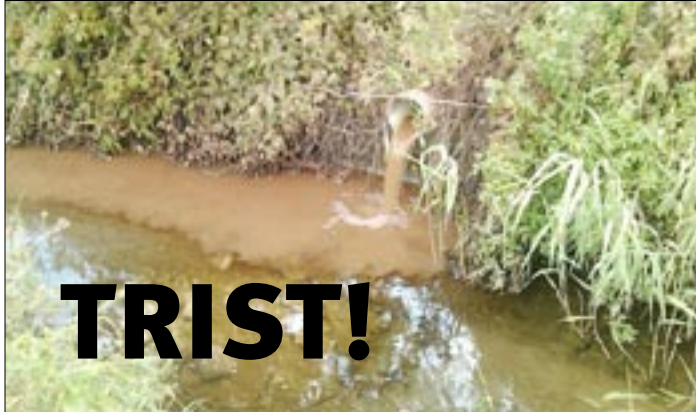
Ingen udledning af urensset spildevand, tak!

Efter en noget våd vinter er åerne nu ved at være normale igen, desværre lykkedes det kun delvis at få optalt gydegravningerne, men resultatet af tællingen på vores zone 3-4 er igen meget dårlig, faktisk det laveste vi endnu har registreret.