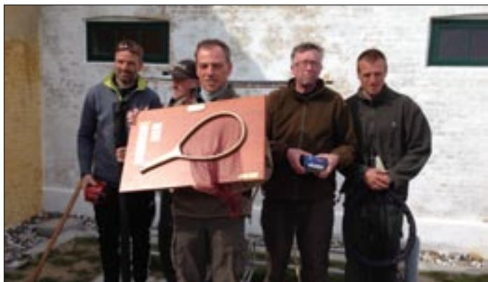
Præmievinderne og 3 Slagelse-folk med "Den Gyldne Kejs".

bevæge sig lidt (meget), kan man fiske på områder, hvor der stort set ikke kommer andre. Vi der kørte til Møn nåede kun at fiske 4 timer og havde på den korte tid kontakt med 6 ørreder. 1 røg af og en anden var under mindstemålet, som i dagens anledning var sat til 45 cm. Men 4 fine ørreder med til indvejning. Holdet fra Langeland havde 2 ørreder med. Nu var det spændende, om disse 6 fisk var nok. Vi startede med at indveje vores og så gik det ellers stille og roligt med lidt fisk til indvejning hist og her. Lige inden fristen for indvejning udløb kom så Sorø folkene med poser fulde af torsk. Øv, tænkte jeg, så røg trofæet. Men nej, ved opgørelsen viste det sig, at vi havde 900 point imod Sorø's 820 point. Vi vandt og er nu indehaver af både forårets og efterårets cup trofæer. Individuelt løb vi med 2 – 3 og 4 pladsen i ørredklassen. Godt gået og tak fordi så mange støttede op. Jes