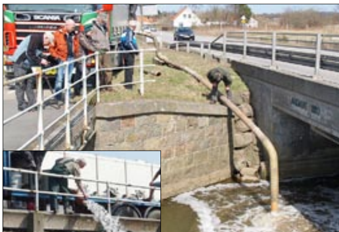
Fiskene udsættes fra tankvogn.

gennem Projekt Vildfisk. Så hvis I møder dem på kysten i den kommende tid, så find en anden fiskeplads, de tåler ikke mødet med en fiskekrog. Jens