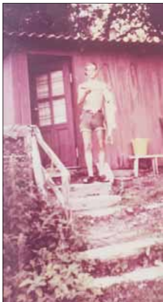
3 gamle billeder fra 1959 (s/h)-1963 (farve) fra hytten ved Tystrup Sø