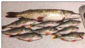
Et udsnit af gode aborre og gedder.