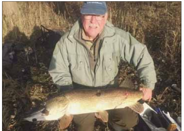
Gedde 10,52 kg, lokal mose.