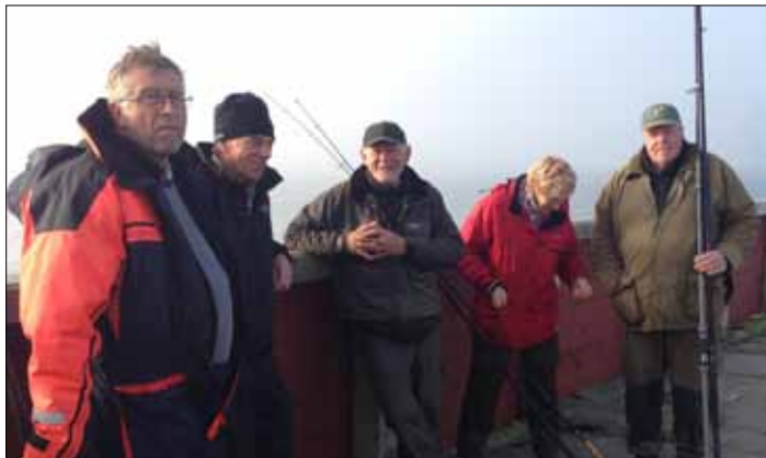
En del af holdet fra Flådestationen Korsør.