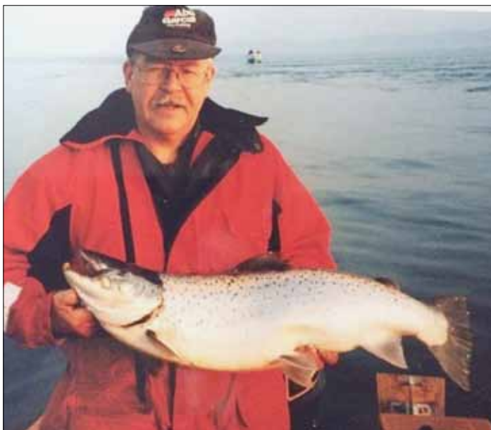
Største Havørred 7,0 kg 1999.