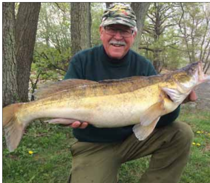
Største Sandart Tissø 5,1 kg 2019.