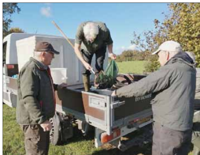
Fra UFV's udsætning af 28.300 stk. 1/2 års fisk lørdag den 17. oktober 2020.