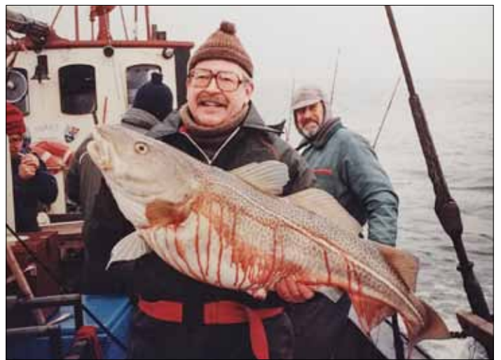
Største Torsk 19,8 kg, Øresund, 1990.