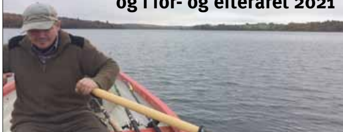
Udsigt udover den smukke Tystrup Sø.

Lørdag den 31/10 havde foreningen en introtur til Tystrup sø for nye medlemmer. Vi havde en fantastisk dag med 7 mand i alt. Der blev vist og fortalt om stederne og pladserne på den dejlige sø som også resulterede i flere gode aborre og gedder i det fantastiske vejr. Michael Haupt