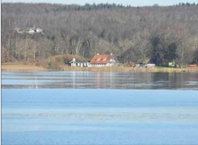
Her ses helikopter og ambulance ved Tystrup Sø.

Jeg var idag, 27. november 2020 lige før middag, på Tystrup Sø i jolle 2, hvor jeg var ude for en noget rystende oplevelse, der heldigvis endte godt. Bedst som jeg var igang med at vertikalfiske på en stor fisk hører jeg et rabalder og et plask. Jeg kigger op og ser at der ca. 3-400 meter væk er en alujolle uden nogen personer i, men som ligger underligt og ruller nærmest. Jeg kan godt regne ud, at nogen er faldet i vandet, og ror det hurtigste jeg har lært. Ved alujollen ligger en ældre mand i vandet. Jeg prøver at trække ham op, men det er umuligt, da han har vådt tøj og waders på. Hans redningsvest er røget op over hans hoved, da han åbenbart ikke har haft den spændt på over maven. Det er kritisk, især fordi vandet er hunkoldt og hans hoved er halvt under vand. Jeg får hans ene ben op i alujollen og får et ankertov ind under ham. Nu har jeg ham fiskeret, mens jeg med venstre