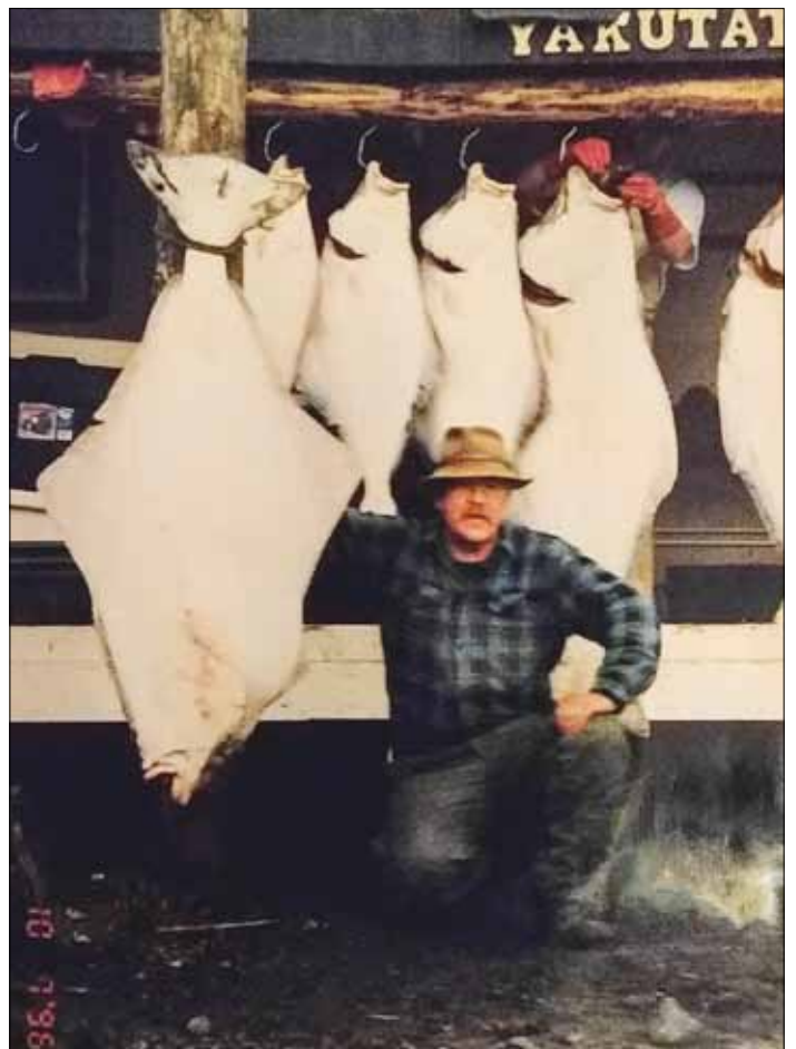
Helleflynder 125 lb ca. 57 kg, 1996.