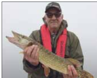
En heldig fisker med flot gedde.

Lørdag den 31/10 havde foreningen en introtur til Tystrup sø for nye medlemmer. Vi havde en fantastisk dag med 7 mand i alt. Der blev vist og fortalt om stederne og pladserne på den dejlige sø som også resulterede i flere gode aborre og gedder i det fantastiske vejr. Michael Haupt