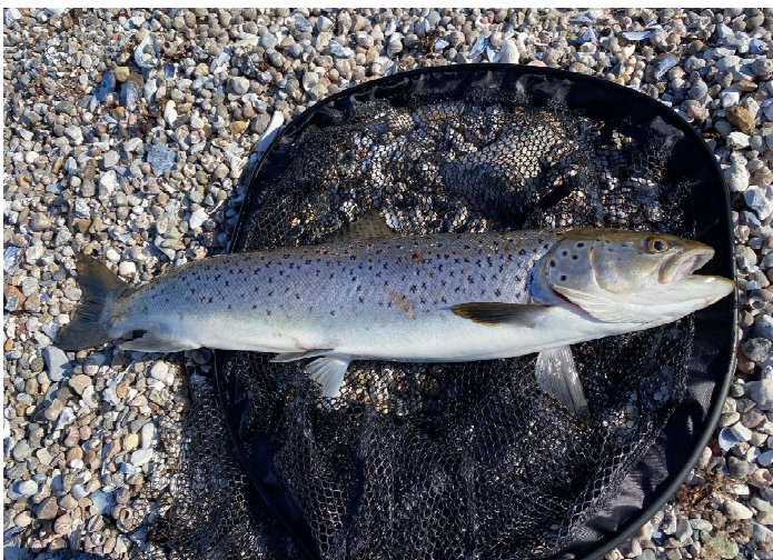
En af ørrederne fra pointturene.